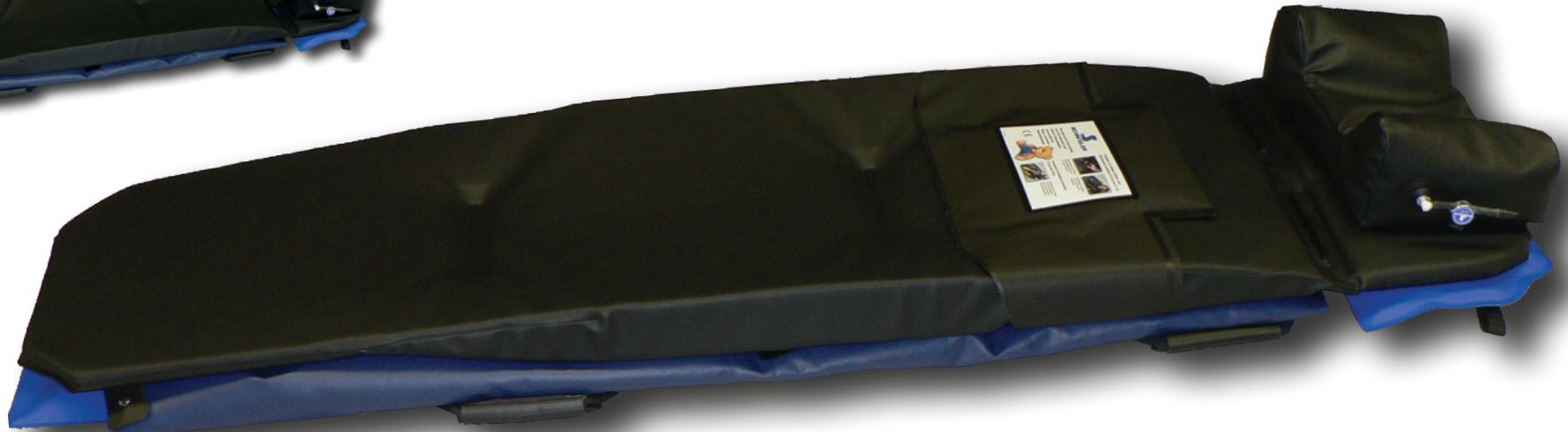
Vakuum-Matratze mit Tragenauflage inkl. Baby- und Kinder-Rückhalte-System