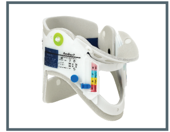
Ambu® Perfit ACE®